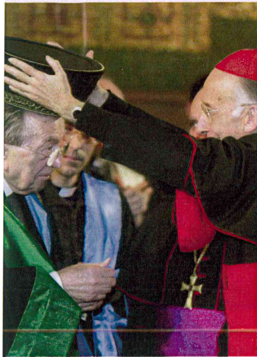
A FIANCO: IL CARDINALE RUINI CON GIULIO ANDREOTTI NEL 2004. SOTTO: DURANTE UNA CELEBRAZIONE.