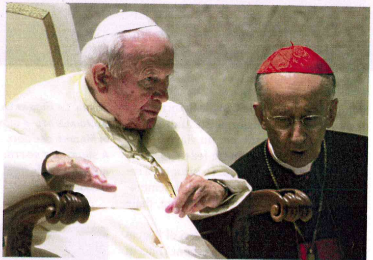
IN BASSO: IL CARDINALE CON BENEDETTO XVI NEL 2008.