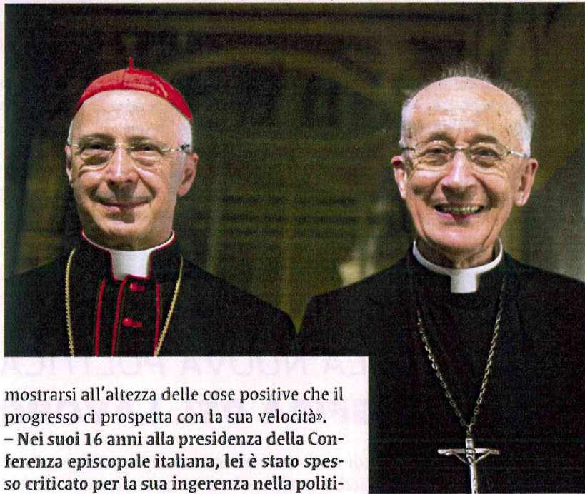
IL CARDINALE CAMILLO RUINI CON IL SUO SUCCESSORE ALLA PRESIDENZA DELLA CEI ANGELO BAGNASCO.

mostrarsi all'altezza delle cose positive che il progresso ci prospetta con la sua velocità».